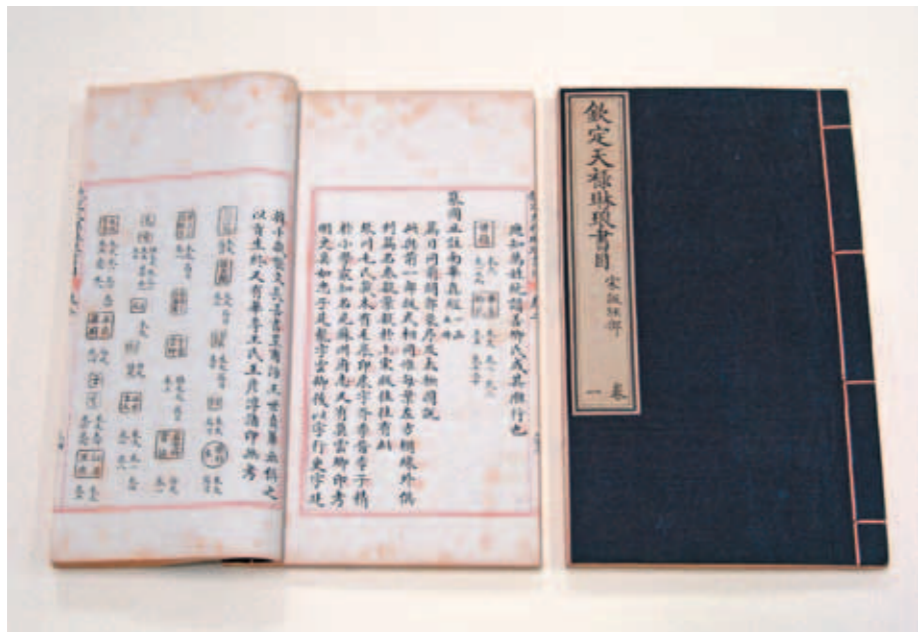
圖十 《天祿琳琅書目》 清乾隆間內府寫本 國立故宮博物院藏

畫、書札卷冊等，經私人藏家組合重裝，入清後保留原貌或再拆裝，皇帝親書題簽，或於對幅題寫詩文，成為皇室收藏的特殊面貌。乾隆八年