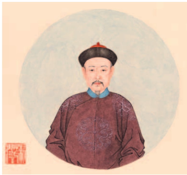
圖八 《清高宗御製詩集》 乾隆畫像 局部 國立故宮博物院藏