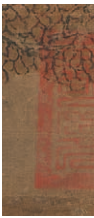
圖六 典禮紀察司印 國立故宮博物院藏 取自五代梁關仝《秋山晚翠圖》

一六四四年，滿洲大軍入關，定都北京，建立清朝（一六四四—一九一一），接收明朝內府所藏，在聖祖康熙皇帝（一六六二—一七二二在位）、世宗雍正皇帝（一七二二—一七三六在位）、高宗乾隆皇帝（一七三六—一七九五在位）的經營下（圖八），內府典藏更較明代豐盛，經由臣工獻納、朝廷出資徵購或查抄不法者家藏，以及宮廷造辦處雲集南北工匠競技，奉旨創製各式器用，或用於宮殿廳堂陳設，或收貯於內廷齋室把玩，包括琺瑯器、漆器、玉器、玻璃器、琺瑯彩瓷及文玩雕