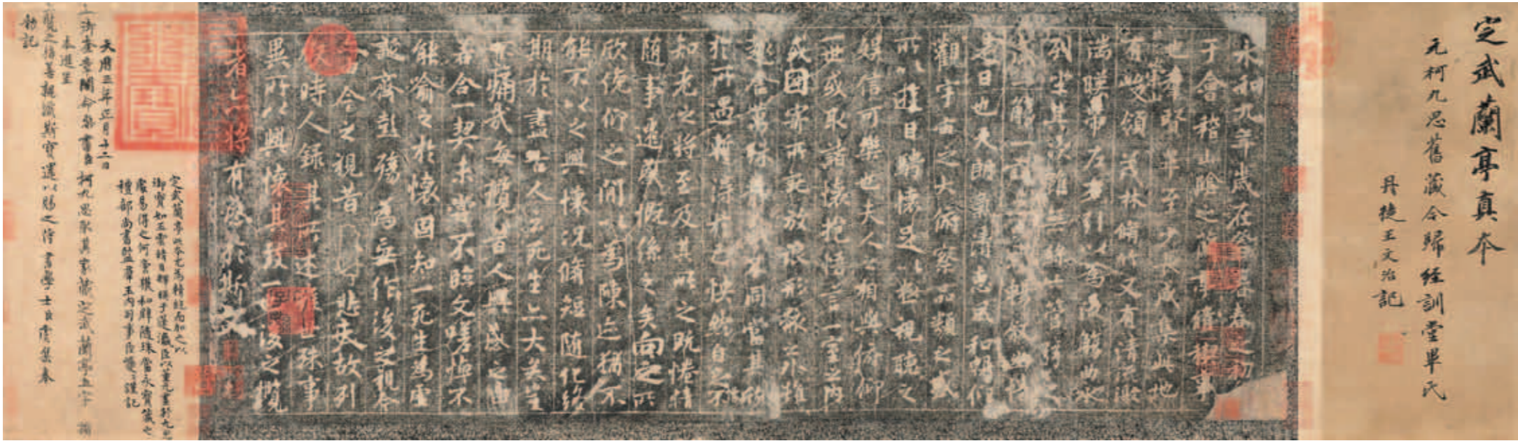
圖五 定武蘭亭真本卷 國立故宮博物院藏