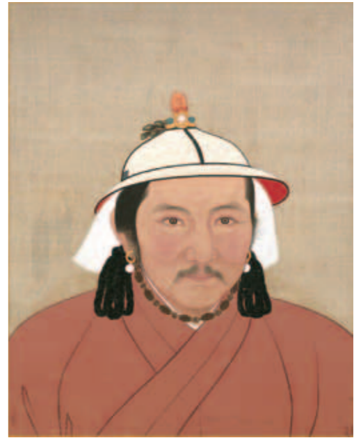
圖四 元代帝半身像 冊 元文宗 國立故宮博物院藏

一二七九年蒙古人滅南宋，皇室收藏盡入元朝內府，初由秘書監掌理圖籍、書畫及古器物等。在大都任官的詩人與學者王惲（一二二七—一三〇四）曾經寓目宮中所藏書畫，撰為《書畫目錄》，提到世祖至元十三年（一二七六）冬天，平定江南後，將圖書禮器運送到京師，並詔許京師官員觀賞，王惲隨手記錄了書法一百四十七幅，繪畫八十一幅，其中就包含了前述唐孫過庭《書譜》卷，另有懷素《自敘帖》及宋代帝后像，至今均為故宮重要典藏。