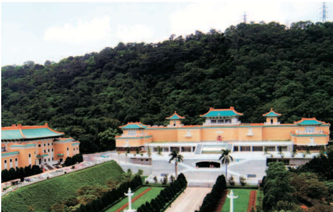
(上) 1925年故宮博物院創建時之全景 (下) 國立故宮博物院今貌