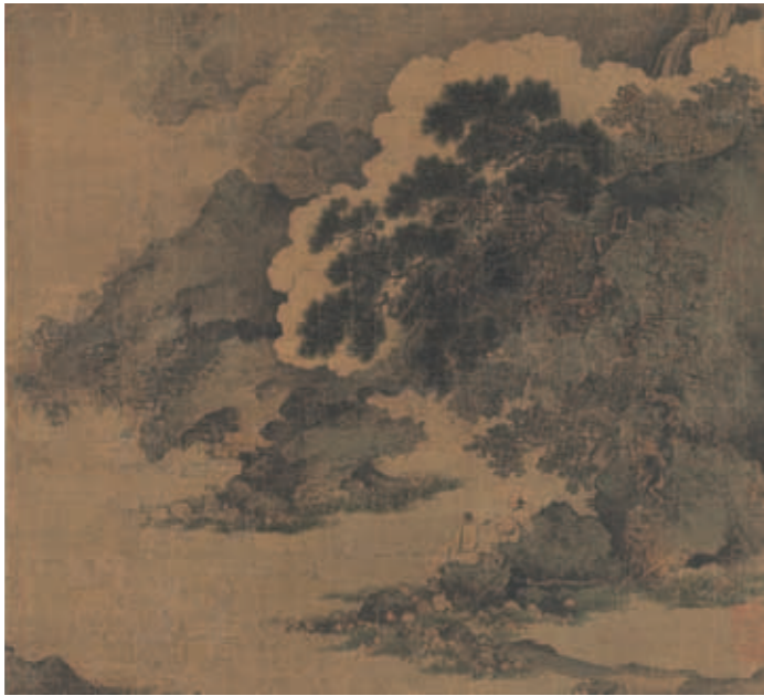
圖三 藝苑藏真(上) 冊 (傳)宋李唐 坐石看雲 國立故宮博物院藏

此外，北宋朝廷抑武尚文，隨著文化與生活品質提昇，各地瓷器工藝愈為精詣且具有地方特色，朝廷重視下，河北定州白瓷、陝西耀州青瓷、江西饒州青白瓷、福建建州黑瓷，紛然進御，本院今日所藏均奠基於此。此外，徽宗時期更在汝州燒造出釉色天青溫潤且微具天然開片、造形簡鍊柔和的汝窯青瓷，存世稀少，在瓷器美學上具有典範地位。 一一二七年，興起於東北方的金朝（一一一五～一二三四），攻陷北宋首都汴京，皇室收藏易主，大部分被運到燕京（今北京），成為金朝皇帝的收藏，如前述唐摹王羲之〈遠宦帖〉卷即有金章宗（一一九〇～一二〇八在位）的鑑藏印記。不過戰亂中許多文物遭受毀損或流散民間。南宋偏安江南，高宗趙構（一一二七～一一六二在位）承襲宮廷傳統，從民間徵集流散的書畫，並透過與金人交易，換取舊藏文物，恢復部分宮廷收藏，五代南唐巨然〈蕭翼賺蘭亭圖〉軸及宋人〈江帆山市〉卷即為當時紹興內府所藏。另外由臣工進獻之物，