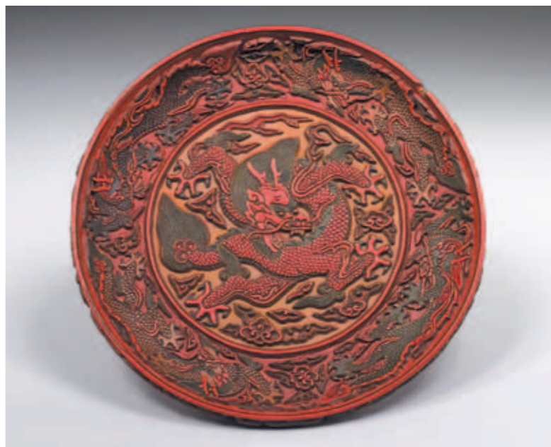
圖七 明 嘉靖 剔彩漆九龍圓盤 國立故宮博物院藏

以後，重回清宮。其他明末清初大收藏家如項元汴(一五二五~一五九〇)、吳廷(十六世紀後半)、宋犖(一六三四~一七一三)、耿昭忠(一六四〇~一六八六)、安岐(一六八三~約一七四六)等收藏在清初大多徵入內府，宋代名家繪