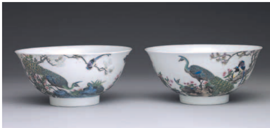
圖九 清 雍正 琺瑯彩孔雀紋碗 國立故宮博物院藏