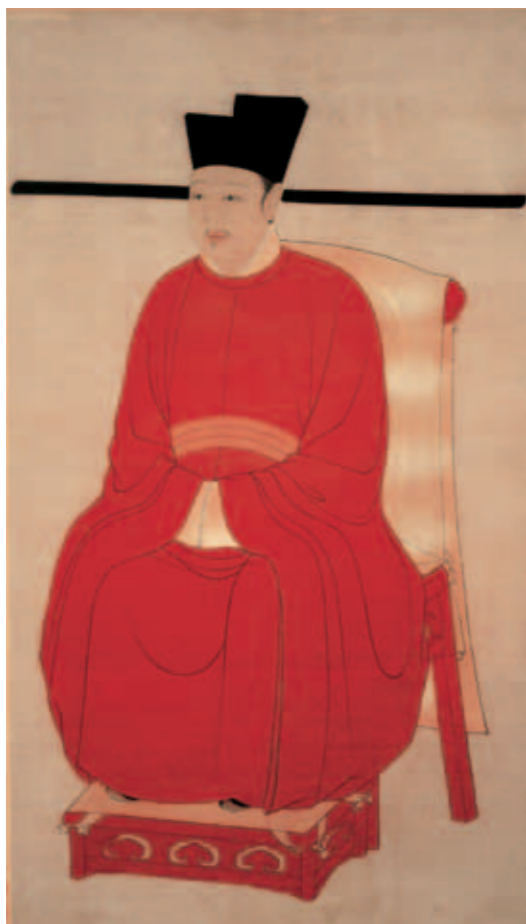
圖一 宋徽宗坐像 軸 國立故宮博物院藏

故宮在北溝，地處偏僻，交通不便，保存重於展示，因此於一九六四年開始在臺北近郊外雙溪籌建新館，明年八月完工，文物由臺中運抵新館，十一月，於國父孫中山先生百年誕辰紀念日，舉行新館落成典禮，蔣總統親題「紀念國父百年誕辰—中山博物院」門額；同時修訂組織章程，正式定名為「國立故宮博物院」，以整理、保管、展出故宮博物院及中央博物院所藏歷代文物，並加強中國古代文化藝術之研究為設置宗旨。