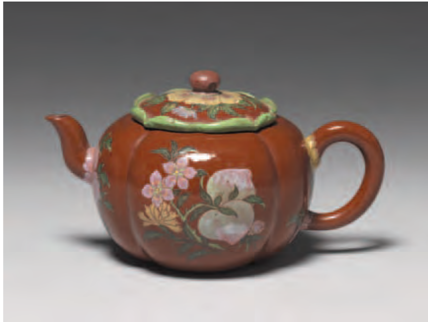
圖二 清 康熙 宜興胎畫琺瑯萬壽長春海棠式茶壺 國立故宮博物院藏

件)。第二式為杉木染楠木色燙蠟插蓋匣樣一件(匣橫頭一處刻永樂暗款脫胎暗龍鳳葵撓碗十二件,係頭等,填黃色,內盛此碗十二件)。第三式為楠木燙蠟插蓋匣樣一件(匣蓋上刻宣得(應為德字之誤)青番花白裡暗花撓碗六件,係頭等,填綠色,內盛此碗六件)。乾隆皇帝看過之後的裁