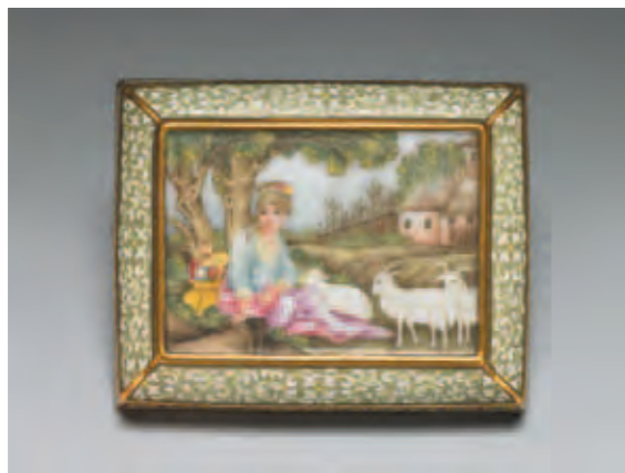
圖十二 清 乾隆 琺瑯彩瓷開光三羊圖長方盒 國立故宮博物院藏

宮的洋彩瓷器，在數量上明顯地超過瓷胎畫琺瑯。不僅如此，八月十七日的典藏紀錄中，還出現乾隆皇帝降旨將三十七件洋彩瓷器歸入「乾清宮頭等」項下，而十件瓷胎畫琺瑯則歸入