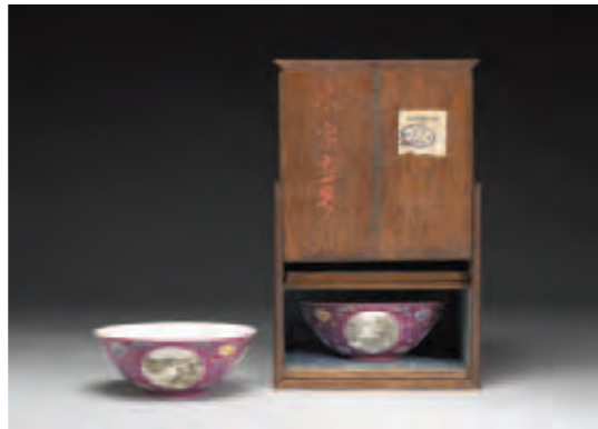
圖六 清 乾隆 洋彩紅地開光四季山水紋碗及其木匣 國立故宮博物院藏