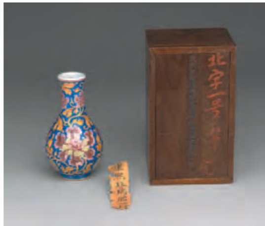
圖七 清 玻璃胎畫琺瑯藍地牡丹紋瓶及其木匣 國立故宮博物院藏

乾隆四年，相對於一百〇四件清宮舊藏瓷器入列典藏整理的計畫，該一年度僅有一件八卦爐獲准收入「乾清宮康熙年製琺瑯器皿」內，二件銅胎製品和一套金胎作品入列至「乾清宮琺瑯器皿」內（乾隆四年，乾清宮項下紀錄）。 乾隆五年（一七四〇），相對於被提出來重新建築等約六百四十四件左右的清宮舊藏瓷器（乾隆五年，乾清宮項下之紀錄），總計有一百四十左右的件畫琺瑯器獲准配匣。其中三十六件為銅胎，一百〇四件為瓷胎製品。銅胎製品中又可細分出一件獲准「入在乾清宮交出配匣頭等琺瑯器皿內」，五件「入在乾清宮乾隆款配匣琺瑯器皿內」，其餘皆「入乾清宮琺瑯器皿一處」。至於瓷胎部分，有七十四件獲准「入乾清宮配匣等次內」（圖八），其餘皆入「乾清宮琺瑯器皿內」。值得注意的是，此一年代的配匣清單中因出現「瓷胎錦上添花畫琺瑯」類型作品，而得以間接說明以錦上添花為飾的瓷胎畫琺瑯，其產燒時間至少可以上溯至乾隆五年左右。