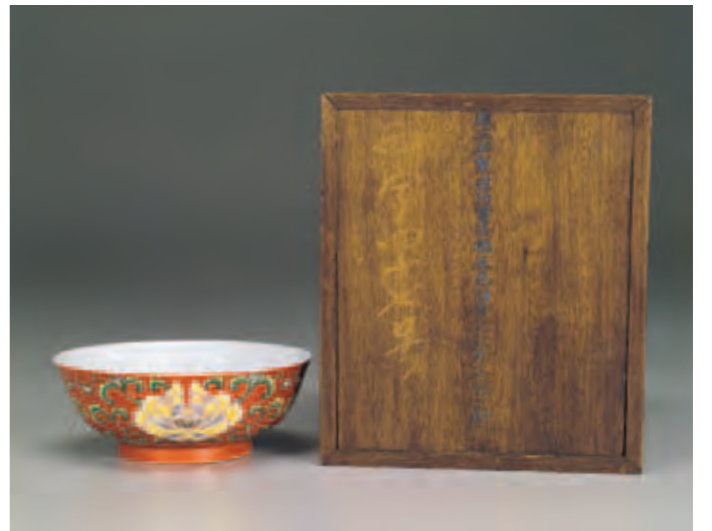
圖四 清 雍正 琺瑯彩（洋彩）畫紅地番蓮紋茶碗及其木匣 國立故宮博物院藏