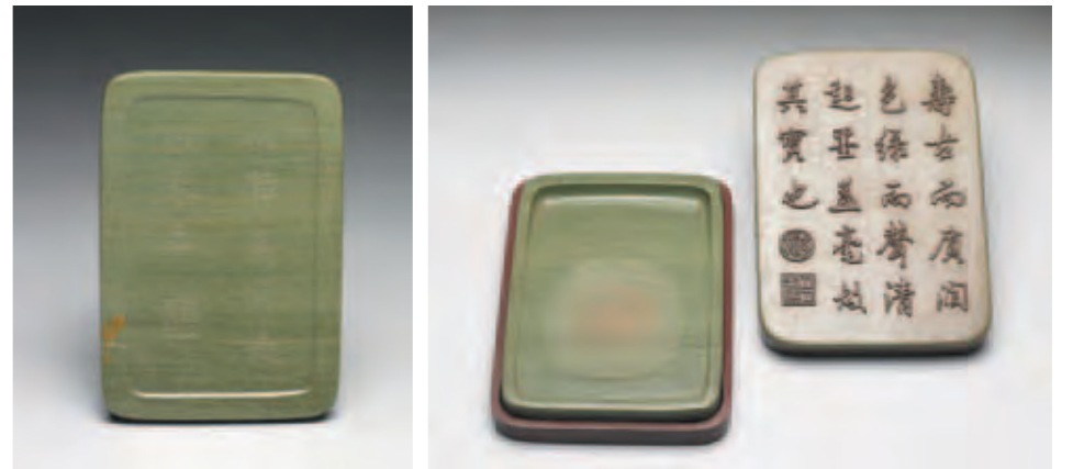
圖十五 清 雍正 松花石文字硯 國立故宮博物院藏

瑯的鑑賞觀，也因為置入更多當朝製品，從另一個面向凸顯出他更加推廣乾隆朝製品的意圖。 其次，透過另一個在相同地點建置的康熙松花石硯典藏（圖十四）