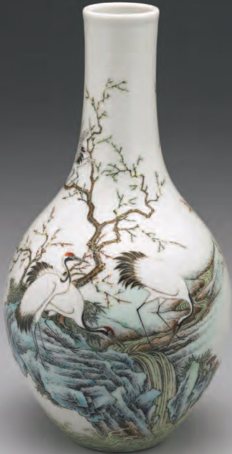
清 乾隆 洋彩畫梅鶴圖膽瓶 國立故宮博物院藏