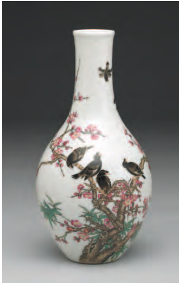
圖八 清 乾隆 琺瑯彩畫花鳥紋膽瓶 國立故宮博物院藏