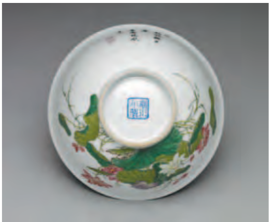
圖十三 清 雍正 琺瑯彩瓷九蓮獻瑞碗 國立故宮博物院藏

又降旨追查畫琺瑯配匣之事是否持續進行，而能感受到他積極規劃此一份典藏的決心（乾隆十五年，記事錄，五月十七日條）。這份想法，再對照乾隆四十二年（一七七七）也降旨將包含康雍乾三朝畫琺瑯器和乾隆朝洋彩瓷器在內，總數共計四十匣七十六件作品送交盛京陳設看來（乾隆四十二年，十月二十七日條），可以進一步觀察出他思及在駐蹕所到之處建置相同典藏的想法。