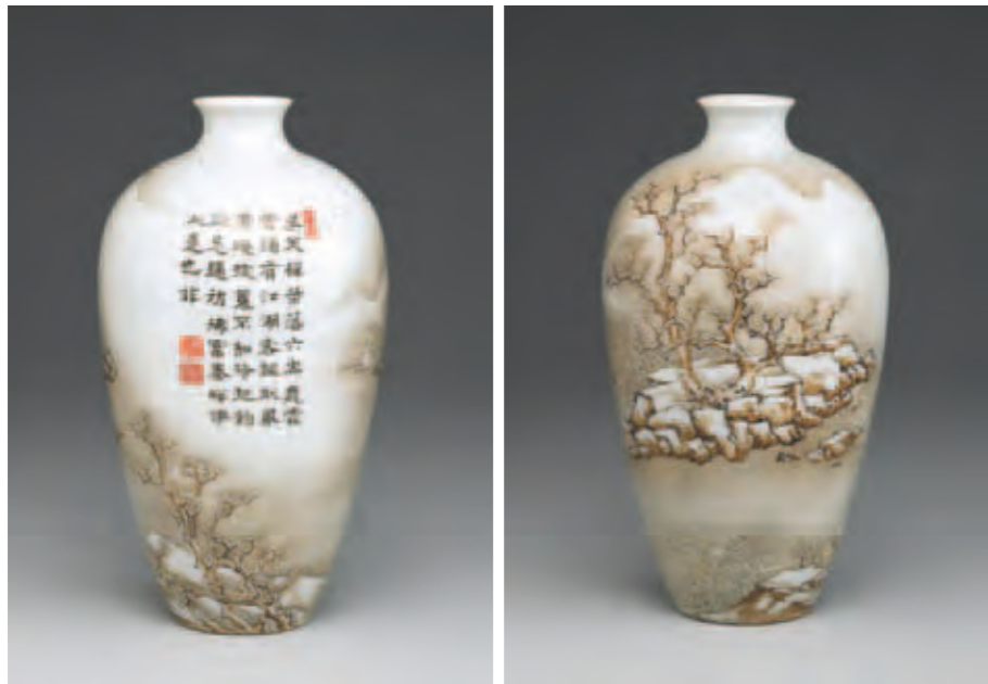
圖十一 清 乾隆 洋彩瓷冬景山水圖梅瓶 國立故宮博物院藏

宮的洋彩瓷器，在數量上明顯地超過瓷胎畫琺瑯。不僅如此，八月十七日的典藏紀錄中，還出現乾隆皇帝降旨將三十七件洋彩瓷器歸入「乾清宮頭等」項下，而十件瓷胎畫琺瑯則歸入