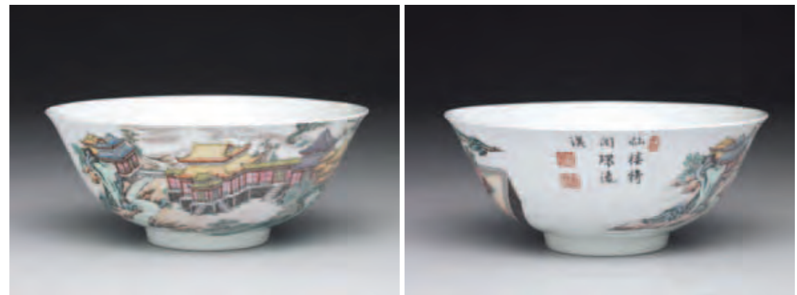
圖十 清 乾隆 琺瑯彩瓷山水樓閣圖碗 國立故宮博物院藏

乾隆六年（一七四一），相對於被重新提出來建等的五十八件清宮舊藏瓷器，總計有二百二十件畫琺瑯器和洋彩獲准配匣盛裝（圖九），其中五件為宜興胎製品、二十七件為呆白胎玻璃器（多數為鼻煙壺）、六十四件為銅胎製品、六十二件為瓷胎畫琺瑯、六十二件是錦上添花洋彩瓷器（乾隆六年，乾清宮項下紀錄）。洋彩瓷器也出現錦上添花裝飾紋樣，反映出至遲至乾隆六年之際，該一紋樣已成爲流行的新興母題，同時唐英監造錦上添花紋樣的時間，亦可上溯至乾隆六年。再就整理的數量而言，此一年度獲准配匣的康雍乾三朝畫琺瑯器和乾隆洋彩瓷器首度超過清宮舊藏瓷器，從另一個面向透露養心殿和重華宮中收藏的瓷器，該時多數或已整理完畢。