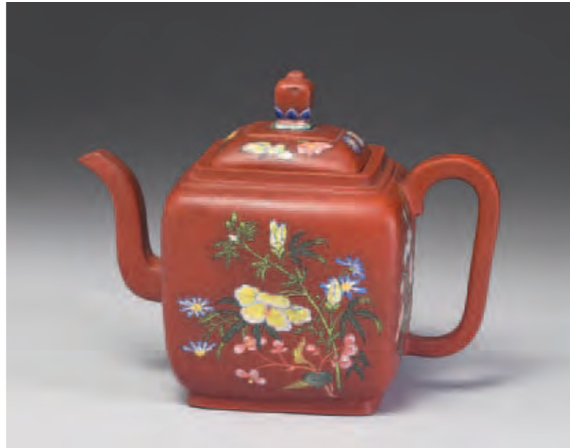
圖一 清 康熙 宜興胎畫琺瑯四季花卉方壺 國立故宮博物院藏

件)。第二式為杉木染楠木色燙蠟插蓋匣樣一件(匣橫頭一處刻永樂暗款脫胎暗龍鳳葵撓碗十二件,係頭等,填黃色,內盛此碗十二件)。第三式為楠木燙蠟插蓋匣樣一件(匣蓋上刻宣得(應為德字之誤)青番花白裡暗花撓碗六件,係頭等,填綠色,內盛此碗六件)。乾隆皇帝看過之後的裁