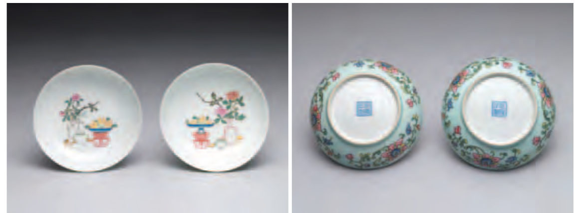
圖九 清 乾隆 洋彩瓷綠地錦上添花花卉碟 國立故宮博物院藏

綜上所述，透過乾隆三年至八年清高宗整理畫琺瑯器和洋彩瓷器的舉例說明中，至少可以整理出以下幾個重點，其一，乾隆皇帝確曾在乾隆三年至八年內積極地整理重華宮和養心殿中的舊藏文物，而且過程中，僅