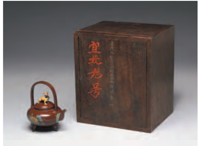
圖三 清 康熙 宜興胎畫琺瑯提梁壺及其木匣 國立故宮博物院藏

胎、玻璃胎和宜興胎在內的康熙乾三朝作品。（註三）同時，傳世猶可見到的康熙乾三朝木匣，從其匣蓋上以直式書寫題名，而非刻寫於匣橫頭的方式，也能推論出一種比較接近頭等的題記方式（圖三、圖七），說明在乾隆皇帝的心目中，康熙乾三朝畫琺瑯器應具有等同於頭等瓷器的品級。 以下再將乾隆四年至八年（一七四三）幾個年度的整理狀況，分述如下：