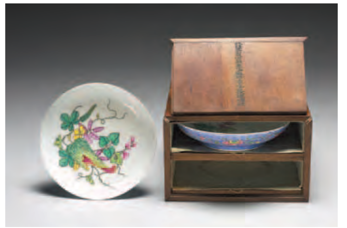
圖五 清 乾隆 琺瑯彩畫藍地錦上添花花卉紋碟及其木匣 國立故宮博物院藏