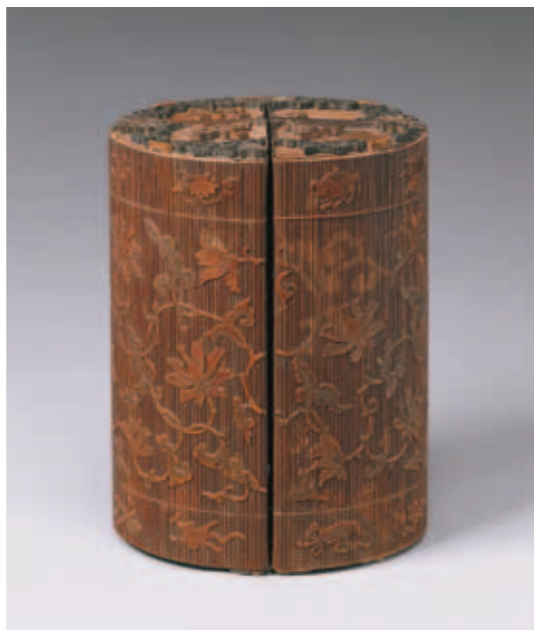
圖四 清 竹絲纏枝番蓮多寶格圓盒 國立故宮博物院藏

代碼，清世宗雍正皇帝以後即作為皇帝寢宮的養心殿，則輪用「呂」字為代碼。因此，欲知養心殿百什件檔冊所載錄的百什件是否為臺北故宮的藏品，只要在「呂」字號的百什件中排比、分析即可。 當年清室善後委員會完成點查工作後，曾編印《故宮物品點查報告》共二十八冊，養心殿的點查報告列於第三編第四冊。數年前（二〇〇四）十月，北京線裝書局將當年清室善後委員會編印的《故宮物品點查報告》重新景印發行，並且將民