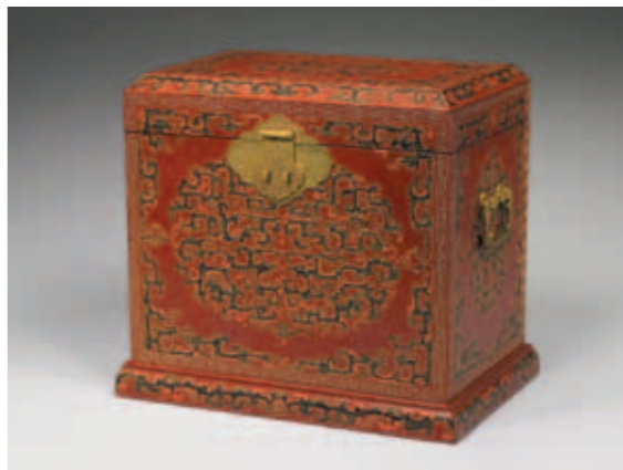
圖二 清 養心殿天球合璧百式件 國立故宮博物院藏 即〈清戲金描漆龍鳳紋箱〉。

院一九七一），道光十九年建立檔冊時貯存於養心殿西暖閣；後者的點查號是呂二〇五八（故漆三五六/院一九五九），同治二年建立檔冊時貯存於養心殿的後殿。（圖一）這兩個百什件中收貯珍玩的履格有些空缺，有小珍玩佚失，然仍泰半留存，「集瓊藻百式件」仍收貯了五十六件珍玩，「瑾瑜匣百式件」更多，有兩百七十五件之多。