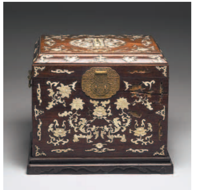
圖一 清 養心殿後殿集瓊藻百式件 國立故宮博物院藏 清乾隆「集瓊藻」木箱。

喜愛收集各式文玩後集貯在同一櫃匣內，在雍正朝的《活計檔》中稱之為「百事件」，乾隆時期《活計檔》則或作「百什件」，或作「百拾件」，有時也被書寫成「百式件」，嘉慶、道光、咸豐三朝的《活計檔》卻總作「百什件」，同治、光緒兩朝的《活計檔》則不見相關記載，宣統僅三年，更不見載錄。至於北京故宮故宮圖書館所藏百什件陳設檔冊，它們的書名題簽皆作「百式件」。不論「百事件」、「百什件」、「百拾件」或「百式件」，其意總是指稱眾多、龐雜。為行文統一計，除非引用原檔文字，否則本文皆用「百什件」之名。 雍正元年(一七二三)正月二十七日的《活計檔·匣作》記載清世宗傳旨：「將養心殿原陳設的『百事件』持來朕看。欽此。」其後接續載錄這個「百事件」的過往資料：原來它是康熙五十七年(一七一八)正月初八日奉旨交給「造辦處收著的錦匣」，其內「盛『百事件』一分，共計一百八十八件」；康熙六十一年(一七二二)十一月二十五日點查完