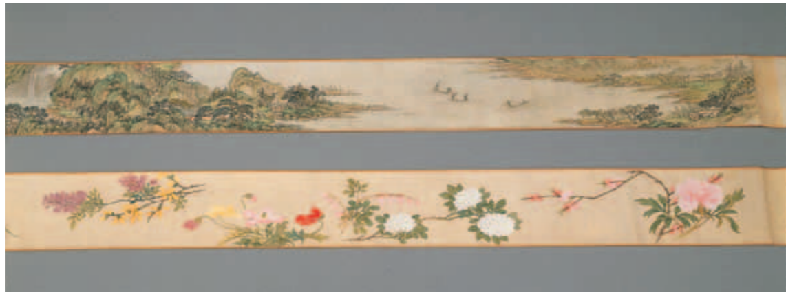
圖八 上：清 方琮 畫山水卷 局部 國立故宮博物院藏 下：清 楊大章 畫花卉卷 局部 國立故宮博物院藏

盡設計之能事。格層內收貯了二十七件小文玩，除有古代與清代玉器，尚有清代乾隆朝內廷畫畫人的繪畫作品，有三件手卷與一套冊頁。每一個扇形的最下層之三角形抽屜內應收納一件手卷，目前僅餘三件，分別是楊大章與李秉德所繪花卉卷，以及方琮所繪山水卷。（圖七、八）其中一個扇形中央的三角形抽屜中收納了一套金廷標所繪人物小冊頁。（圖九）每件手卷縱長僅七公分左右，冊頁的長與寬各僅三公分左右，幾乎可說是臺北故宮所藏最袖珍的手卷與冊頁了。