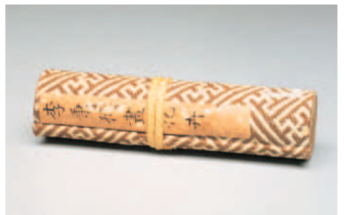
圖七 清 李秉德畫花卉卷 國立故宮博物院藏