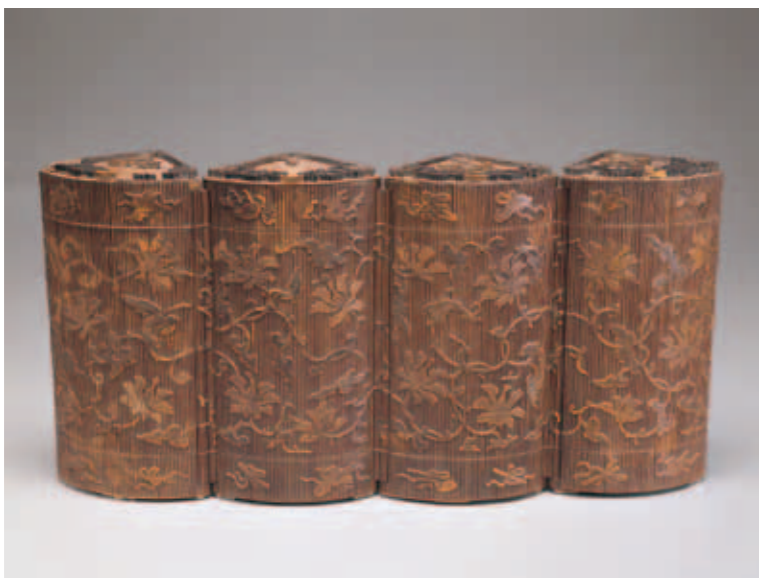
圖十 清 竹絲纏枝番蓮多寶格圓盒 國立故宮博物院藏

後殿竹絲小格百式件》的檔冊書名題簽下端橫貼一張黃簽條，其上墨書楷體「東暖閣」三字，所以雖然道光十九年建立檔冊時，清代〈竹絲纏枝番蓮多寶格圓盒〉貯存於養心殿的後殿，但是後來移至養心殿東暖閣，以備皇帝萬幾餘暇時怡情、遣興，只是移置時間暫無法確認。