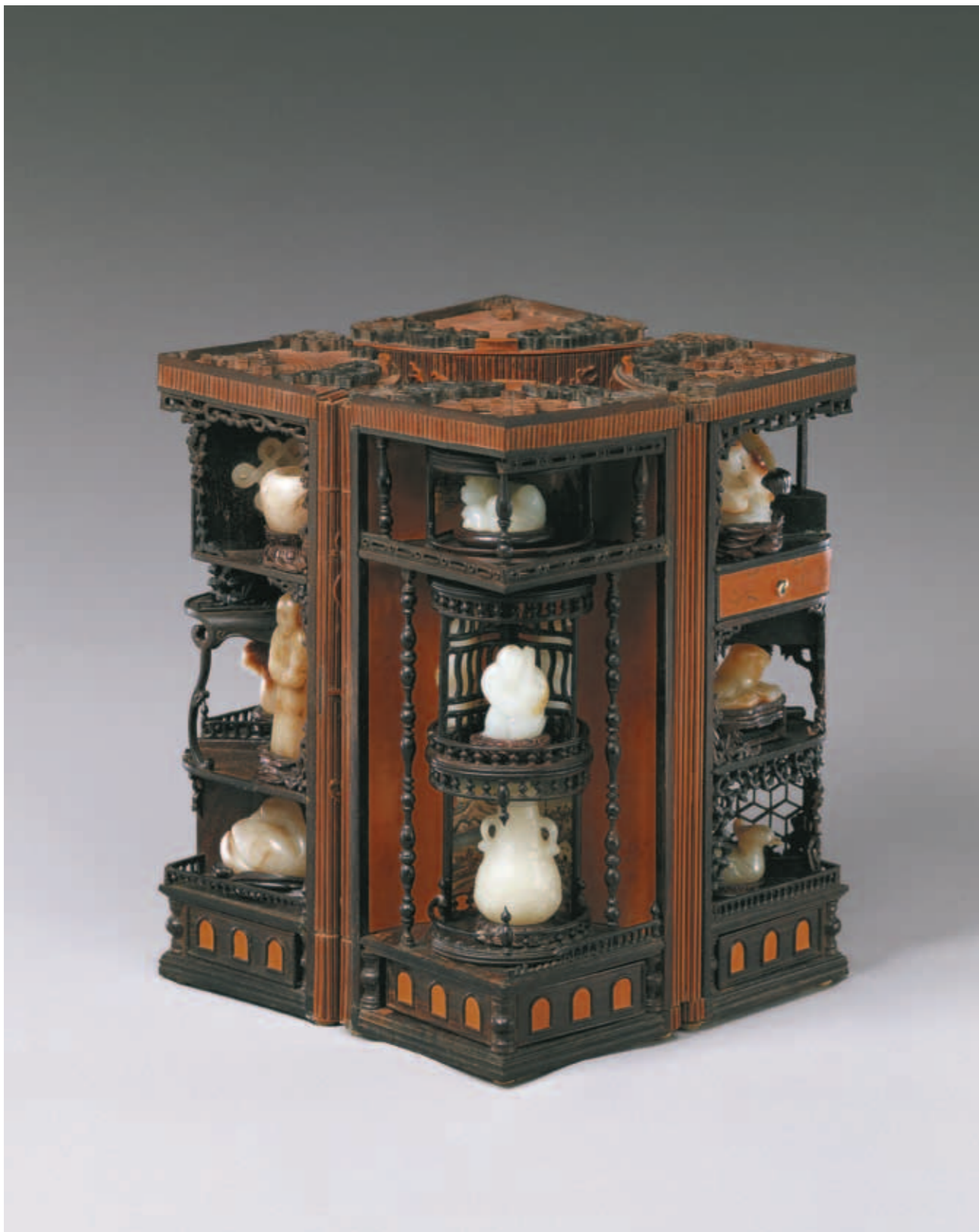
清 竹絲纏枝番蓮多寶格圓盒 國立故宮博物院藏