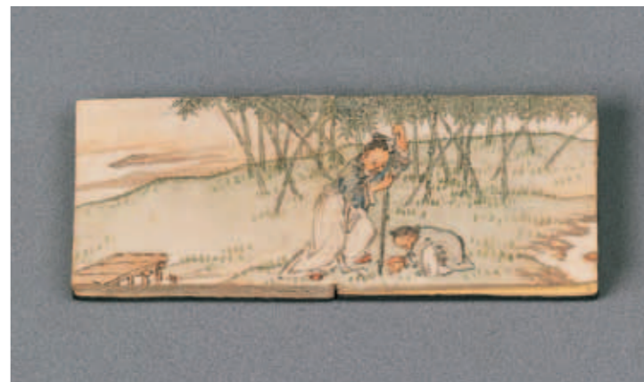
圖九 清 金廷標畫人物冊 局部 國立故宮博物院藏

畫卷，有一個屜格原空，乾隆中期以後，經嘉慶、道光二朝和咸豐九年以前，應即收貯《金廷標醉鄉圖》卷，只是被清文宗於咸豐九年傳旨取走。從畫題並參考前述的人物小冊頁，推測這件醉鄉圖或也是一卷金廷標的人物畫。