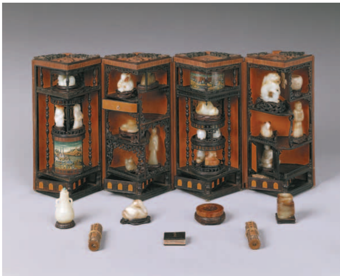
圖五 清 竹絲纏枝番蓮多寶格圓盒 國立故宮博物院藏 打開成小案屏。