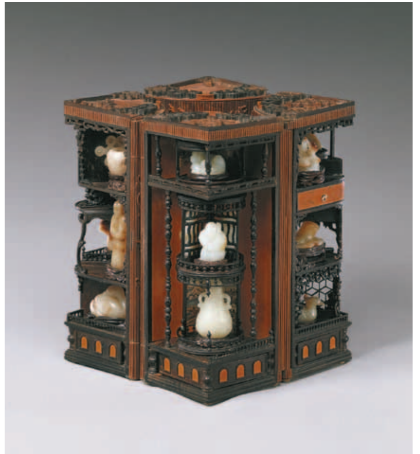
圖六 清 竹絲纏枝番蓮多寶格圓盒 國立故宮博物院藏 360度迴轉後可成一正方柱體。

每個扇形內又分成許多格層，其中圓柱形格層不但再分成數格，而且可以三百六十度旋轉觀賞玉器文玩與西洋風景小畫片。全器匠心獨運，極器身上下又各貼飾八寶一組。