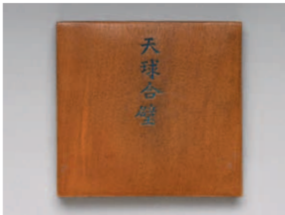
圖三 清 天球合璧冊 國立故宮博物院藏