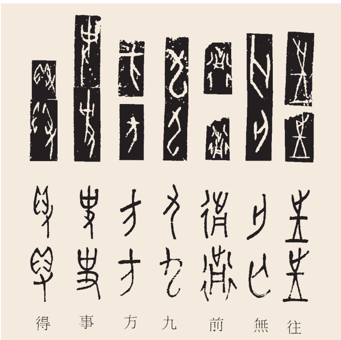
圖四 甲骨文字拓片對照表

門下，在其指導下依《說文》字目序例，編次甲骨文字，完成《殷墟文字類編》。書中以羅振玉、王國維二家考釋為據，間或附加己見，成書時年僅二十一。民國十三年，商氏進入北京大學研究所國學門深造，結業後從事教學研究工作，於南京東南大學、廣州中山大學短暫駐留後，民國十九年又回到北京，一度任教北京大學以