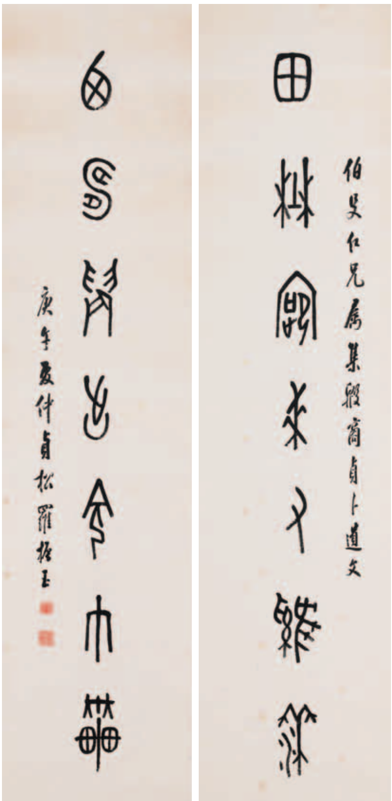
圖一 羅振玉 甲骨文七言聯 國立故宮博物院藏

真相。為求方便運用甲骨資料，羅氏同時進一步多方面購藏出土甲骨，精工細製拓片，與同好切磋研究，尋繹甲骨文與金文、小篆間的關連，如此可以釋讀的字目積累漸多，無意中為集字成聯提供充分的素材。民國十