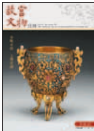
中華民國一〇一年元月 (JAN.2012) 總編號第346期