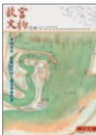
中華民國一〇一年三月 (MAR.2012) 總編號第348期