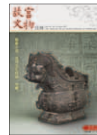
中華民國一〇一年十一月 (NOV.2012) 總編號第356期