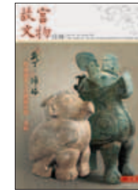
中華民國一〇一年十月 (OCT.2012) 總編號第355期