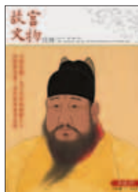
中華民國一〇一年四月 (APR.2012) 總編號第349期