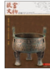
中華民國一〇一年九月 (SEP.2012) 總編號第354期