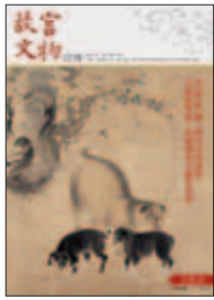
中華民國一〇一年五月 (MAY.2012) 總編號第350期