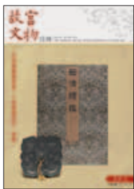
中華民國一〇一年七月 (JUL.2012) 總編號第352期