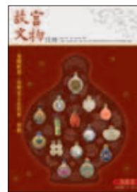
中華民國一〇一年八月 (AUG.2012) 總編號第353期