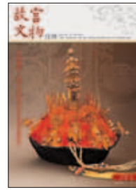
中華民國一〇一年六月 (JUN.2012) 總編號第351期