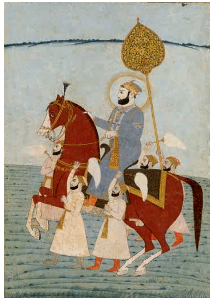
圖十二 法魯和西亞爾 (Farrukhsiyar) 出巡圖 維多利亞與亞伯特博物館藏

進口的象牙因為有體積較大、不易退色，紋路較細緻等特性，最為珍貴。（註五）現存於丹麥 David Collection 的典藏屬於第二類造型，其口部上下端淺浮雕各式優美的花葉紋，上方仍殘留當時的顏料。桿身前粗後細，末端雕作花苞形。美國休士頓美術館典藏一件第一類型塵拂柄，全器以單一根象牙琢製而成。其口部精雕細鏤精美的圖案，如盛開罌粟花與優雅的絲