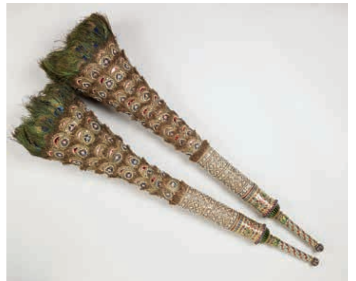
圖十三 金屬塵拂 長94公分 英國皇室藏

柏，桿身雕作扭絲紋，而口部接的居然是一根根削製而成的象牙條，令人嘆為觀止，完美地呈現蒙兀兒工藝技術的精華。英國皇室收藏也典藏四件象牙製塵拂柄，整體造型與休士頓館藏頗為近似。除了上述材質外，還有以檀香木製作而成的柄部，如原存於包威斯城堡的數件典藏，其口部接的是削製而成的細長檀香條，拂動時會傳出陣陣香味。（圖十五）