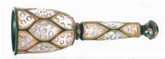
圖十一 18世紀初期~中期 玉塵拂柄 長18.2公分 卡達Al-Thani Collection藏 引自Amin Jaffer ed., Beyond Extravagance: A Royal Collection Of Gems And Jewels , Assouline Publishing, 2013, 頁77.