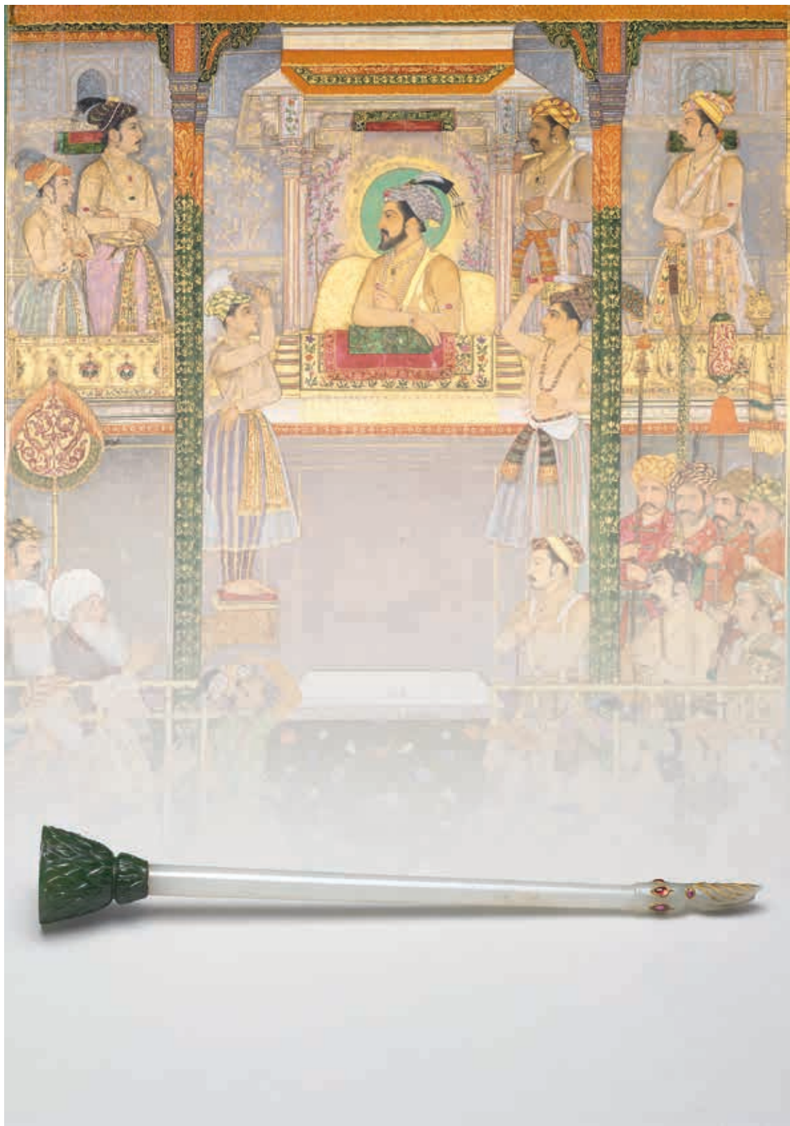
蒙兀兒帝國 帶鑲嵌塵拂柄 長23.2，最寬1.05公分 國立故宮博物院藏