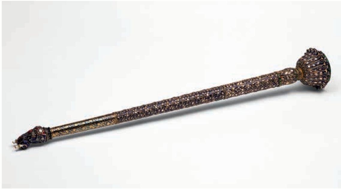
圖十四 19世紀晚期 金屬塵拂柄 長54，徑7.4公分 維多利亞與亞伯特博物館藏