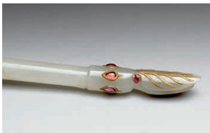
圖二 〈帶鑲嵌塵拂柄〉局部