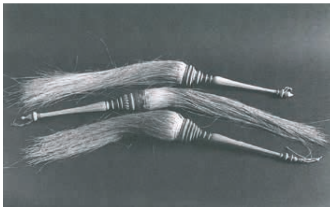
圖十五 檀香塵拂 全長95，柄長38公分 引自 Mildred Archer, Christopher Rowell, Robert Skelton, Treasures from India (The Clive Collection at Powis Castle) , Herbert Press/National Trust, 1987, 頁93.

小結 國立故宮博物院南部院區將於今年底於嘉義隆重揭幕，其中「越過崑崙山的珍寶、院藏伊斯蘭玉器特展」亦將同步推出。除了希冀帶領觀眾認識本院中華瑰寶以外的精彩亞洲典藏，更盼望能藉由各式精美又實用的伊斯蘭玉器，像是這件小巧精緻的塵拂柄，以及許多蒙兀兒王公貴族生活中