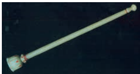
圖十 17世紀晚期~18世紀初期 玉塵拂柄 長29.8公分 卡達Al-Thani Collection藏 引自Amin Jaffer ed., Beyond Extravagance: A Royal Collection Of Gems And Jewels , Assouline Publishing, 2013, 頁62.