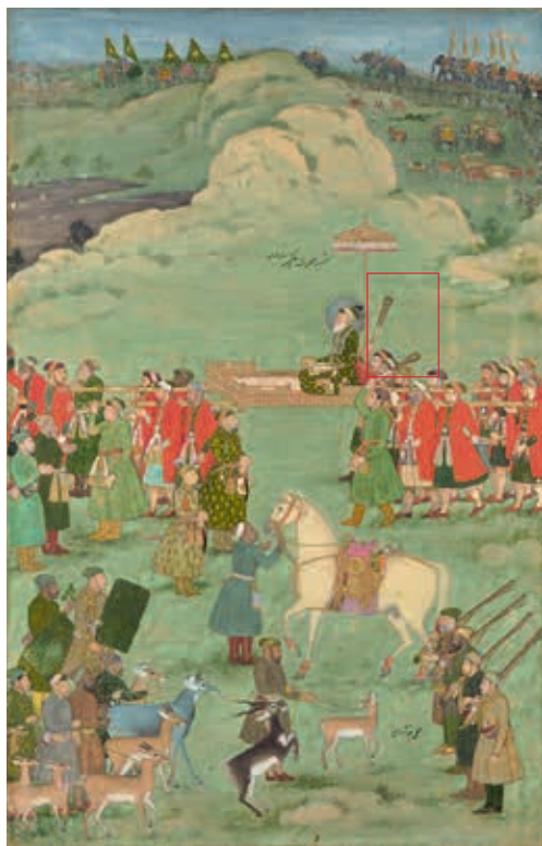
圖五 奧朗則布出巡圖 美國大都會博物館藏www.metmuseum.org

形制考察 從目前所見資料、繪畫與舊照片可知，印度地區的塵拂柄可粗略分為兩種形制：第一種柄部整體造型細長，桿身前端帶一喇叭口，桿身與口部的長度相差較大，口部接長而飄逸獸毛。若該器為皇族所用，則多採用西藏犛牛 (yak) 的尾巴。(註一) 若以英文翻譯印語，通常譯作 chowry、chowrie、chauris 等，本院典藏即屬於此類形制。 第二種塵拂柄造型與前一種相較之下，整體造型顯得較為厚實粗壯，