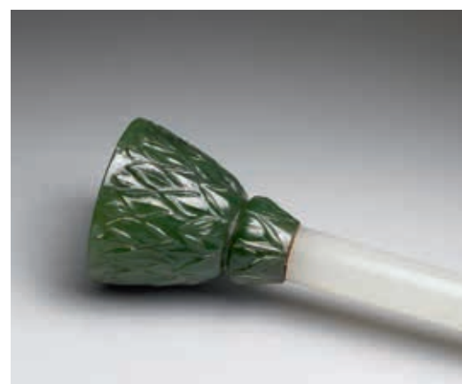
圖三 〈帶鑲嵌塵拂柄〉局部

的玉器收藏，現今統稱為「伊斯蘭玉器」。 這些玉器來自南亞地區的數量最多，許多屬於蒙兀兒帝國藝術發展下的結晶。具有突厥與蒙古血統的蒙兀兒王室除了繼承了中亞祖先愛玉的傳統外，十分獎勵藝術發展，致使蒙兀兒玉雕在第四、五代君王賈汗吉 (一六〇五~一六二七年在位) 與沙加罕 (一六二七~一六五八年在位) 時期達於頂峰。清宮典藏中留存下來的數百件伊斯蘭玉器中，以實用器皿居多，而南亞玉器種類最為豐富多元，包含食容器、生活雜器、宗教儀式相關用品、兵器等。此件蒙兀兒帝國〈帶鑲嵌玉塵拂柄〉是本院目前唯一一件來自印度的玉製塵拂柄，相當珍貴。該塵拂柄原應附加的長毛早已不復存在，只剩玉製柄部。全器可分為兩部分，以潔淨勻亮的白玉琢成一根細長圓桿，頂端連接用碧綠玉料琢製的喇叭口，外側浮雕數層花瓣，桿身末端鑲嵌金絲與紅寶石。整體柄部綠、白玉交相輝映，點綴璀璨奪目的寶石，精雅非凡。(圖一~三)