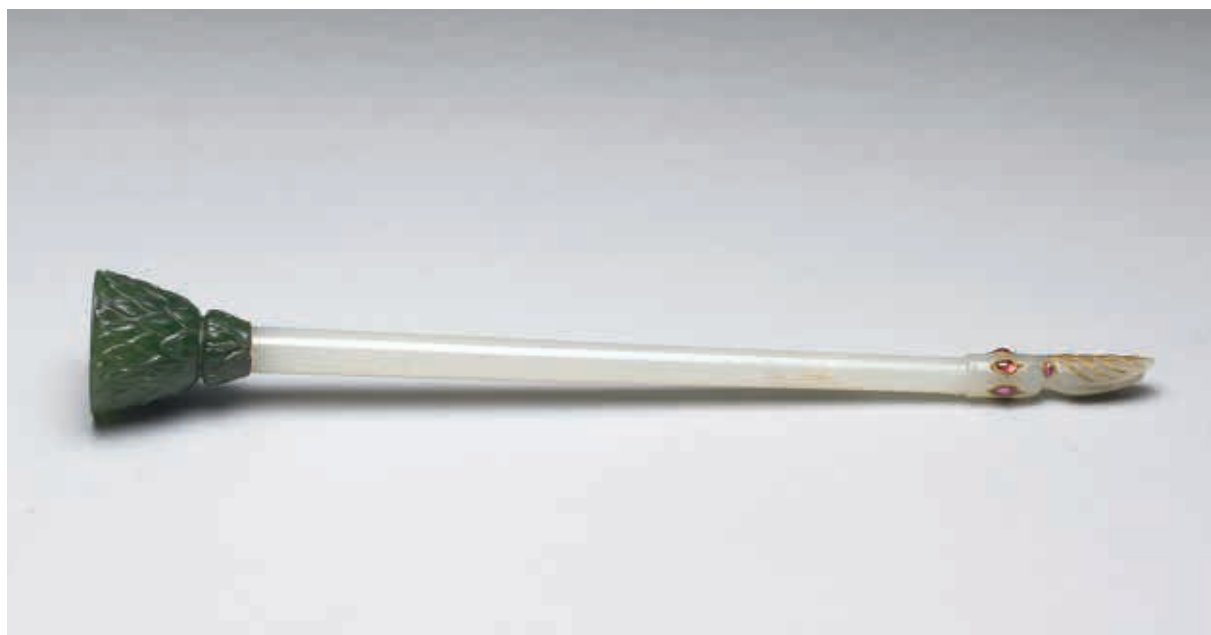
圖一 蒙兀兒帝國 帶鑲嵌塵拂柄 長23.2，最寬1.05公分 國立故宮博物院藏

來搨去灰塵，因此另稱為「拂塵」，是道教文化中常出現的器物。《辭源》載：「拂塵，拂子也，所以去塵及蚊蟲者。古用鹿尾為之，今多用馬尾。」在印度社會中，塵拂更跨越各種宗教，如印度教、佛教、耆那教，經常出現於各種宗教儀式當中，象徵著可以讓人屏除雜念與驅逐世俗煩惱，後來更成為神聖性與崇高地位的象徵。在二〇一二年電影《少年Pi的奇幻漂流》中，我們可以看到印度教信徒在象神 (Ganesha) 神像周圍不停上下揮動塵拂的場景。在信奉伊斯