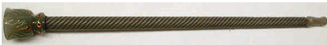
圖八 18世紀 玉塵拂柄 31.4公分 美國大都會博物館藏 www.metmuseum.org

與硬石類塵拂柄相較之下，金屬材質的柄部普遍許多，繪畫中亦最為常見。(圖十二) 英國皇室收藏兩件光彩奪目的第二類型塵拂，是英國威爾斯親王(日後的愛德華七世)於一八七五至七六年出訪印度齋浦(Jaipur)時獲贈的禮物。全器連孔雀羽毛與外圍包覆之織品都保存得相當完整，織品以金線、珍珠組成華麗的圖案(圖十三)，極盡奢華。維多