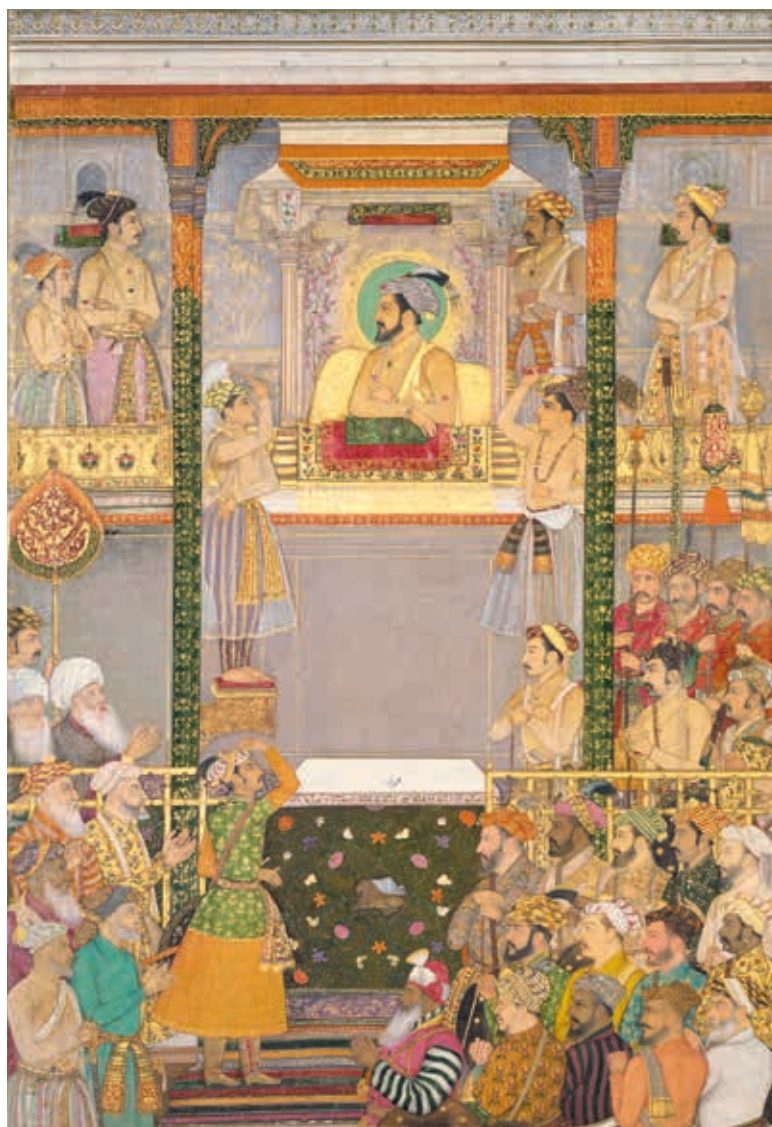
圖六 《帝王紀》中一圖 英國皇室藏

蘭教的蒙兀兒宮廷內，塵拂柄不僅用來驅趕蚊蠅或搨風，更成為宮廷禮制的必備用器。從十六世紀開始，我們可以在諸多描繪宮廷場景的細密畫上，看到畫面中的統治者或主角周遭環繞著許多僕役，經常會有一位專門手持塵拂，高舉於服侍對象的頭部上