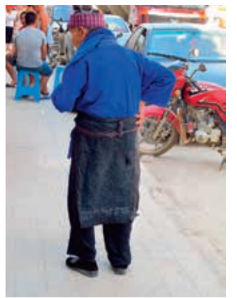
圖四 穿著暗圍腰的施洞老婦人。

的影響，現在中青一輩的女性已經顯少使用，因此成為老年婦人專屬的服飾。（圖四）圍腰中部的構圖，以上下鏡射、左右對稱的連續紋樣為主，並用「路」作為畫面組成的主要架構與視覺引導。（圖五）在女性們織作圍腰中部之前，會先製作花樣本（bend hmub）。它是用類似數紗繡的技巧，用黑色棉線在棉布上臨摹紋樣上機之後經緯的走向，藉此淬鍊整體構圖的平衡性與美感。