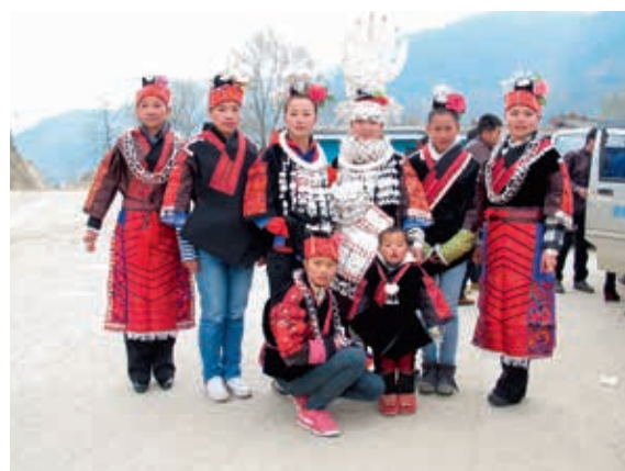
圖二 身穿銀衣並佩戴銀飾的新娘(右三)與身著亮圍腰的少女(左一及右一)。作者2014年2月10日攝於施洞

款式部分會依據圍腰中部的主要紋樣來稱呼。例如以龍紋作為中央主要紋樣的圍腰，即稱作龍圍腰，如果是馬紋為主，即稱為馬圍腰；但由於大圍腰與暗圍腰的紋樣重心，經常會同時使用兩種或兩種以上紋樣作為主要設計，此時便會依照觀者的認定而有不同的稱呼。 以形制來說，以白色棉線作為圍腰中部經軸的是亮圍腰 (qub bat dlob)，搭配紅色系上衣，使用年齡介於十五至五十歲左右。(圖二)以