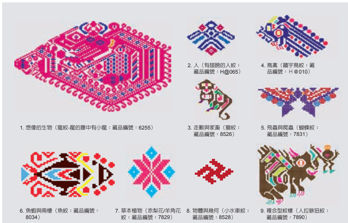
圖七 施洞圍腰的九大類型紋樣（本研究共整理出198種紋樣，此處僅節選9個紋樣作為各類型代表）

弱、嬌小的生物，因此被視作為母性。鳥除了因為有築巢、抓魚的能力而被視作為公性之外，從當地婦女的玩笑話中，也會發現鳥常被隱喻為男性生殖器官。生長在寨子田邊的花，因其透過傳粉繁衍的特性被視作為母性。蝴蝶是美麗的、流動的，被視作為母性。苗族文化中，魚象徵著魚子多產的生殖意象，在施洞當地，更代表著延續父方血緣的理想，因此被視作為公性。青蛙因為有生物變態的特性，因此被視為公性與母性的象徵。窗花紋做裝飾使用。