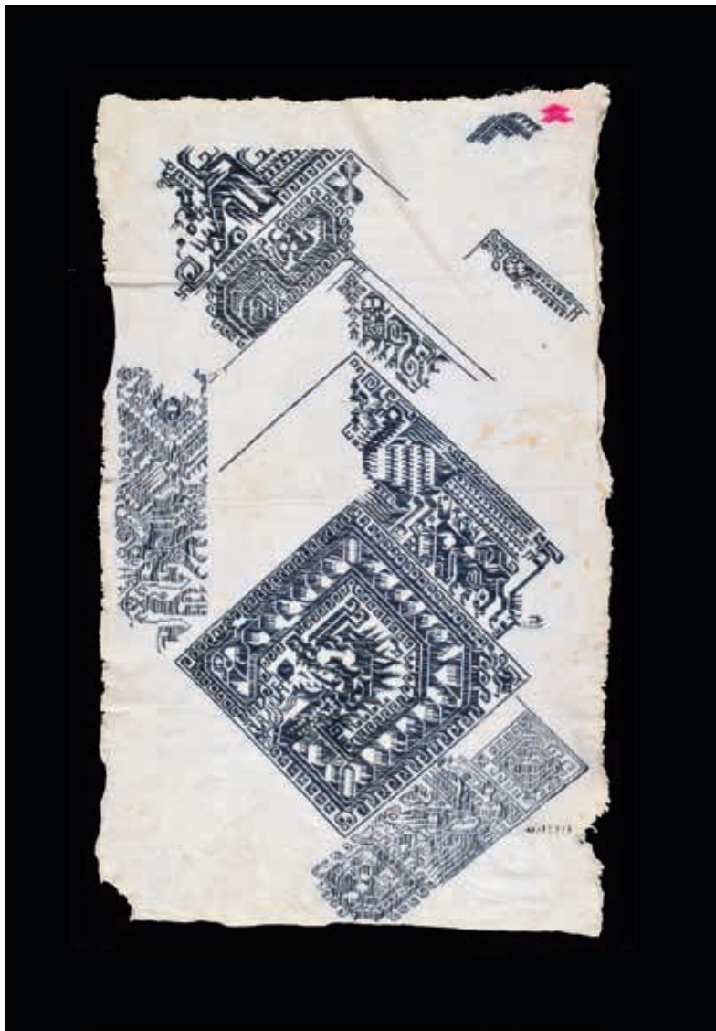
圖六 台江縣施洞苗族圍腰花樣本 天主教輔仁大學中華服飾文化中心藏

基於施洞苗人對於生命的起源，是透過一種互相建構與化外而內，來達到「陰陽相合」的想像而形成，因此構成二元邏輯的宇宙觀。十分有趣的是，除了受到二元宇宙觀的影響，女性們也將對於社會理想狀態的想像，賦予在這些紋樣中，為了達到將生物「部分性別化」以觸發陰陽相合作用的目的，施洞苗人發展出一套結合生態、空間活動範圍（家、野）、人的生活習慣、行走方式、季節時間、體型大小的屬性分類。（註一）由於這些紋樣被賦予這些陰陽屬性相對的角色，我們才能藉此逐層解析圍腰背後蘊藏的意義。