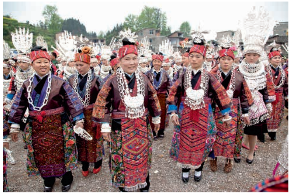
圖三 施洞姊妹節（左1、2：下半身穿著大圍腰、中間3位與右1：下半身穿著亮圍腰、右2：身著整套銀衣）。

圍腰與大圍腰主要於婚禮或盛大節慶時穿著。（圖三）暗圍腰又稱小圍腰，據當地老年人的說法，此款式自女孩懂事後，直至過世皆可穿著，但隨著現代化服飾