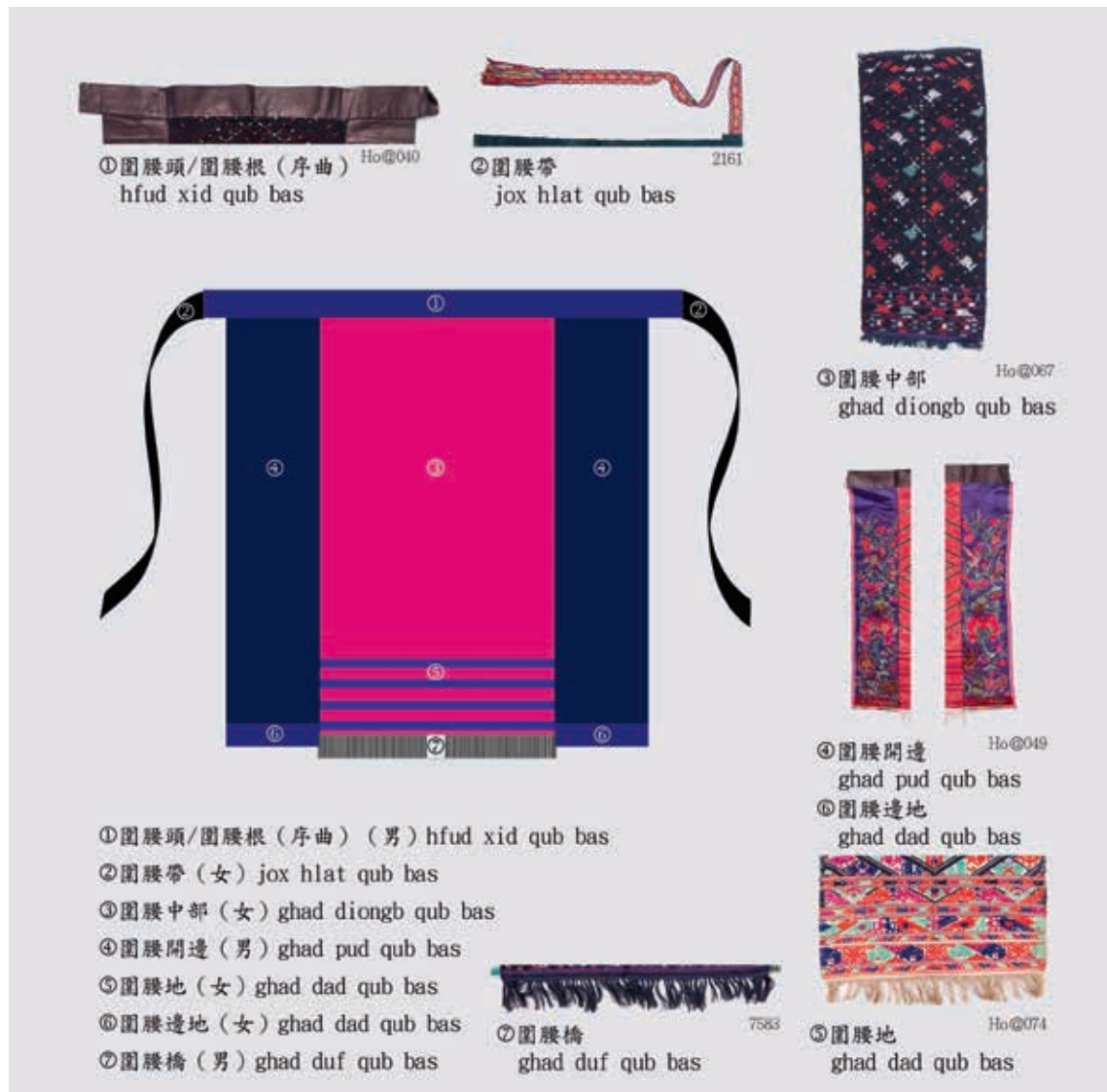
圖一 施洞類型圍腰形制。作者翻繪、整理