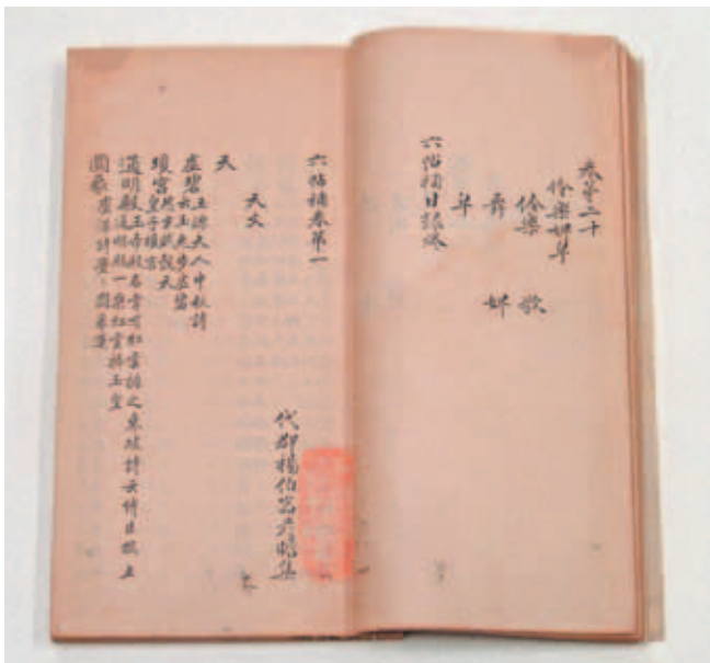
圖一 《六帖補》 楊伯壺 (?-1254) 撰 清康熙傳鈔宋淳祐甲辰(四年)衢州儒學本 國立故宮博物院藏