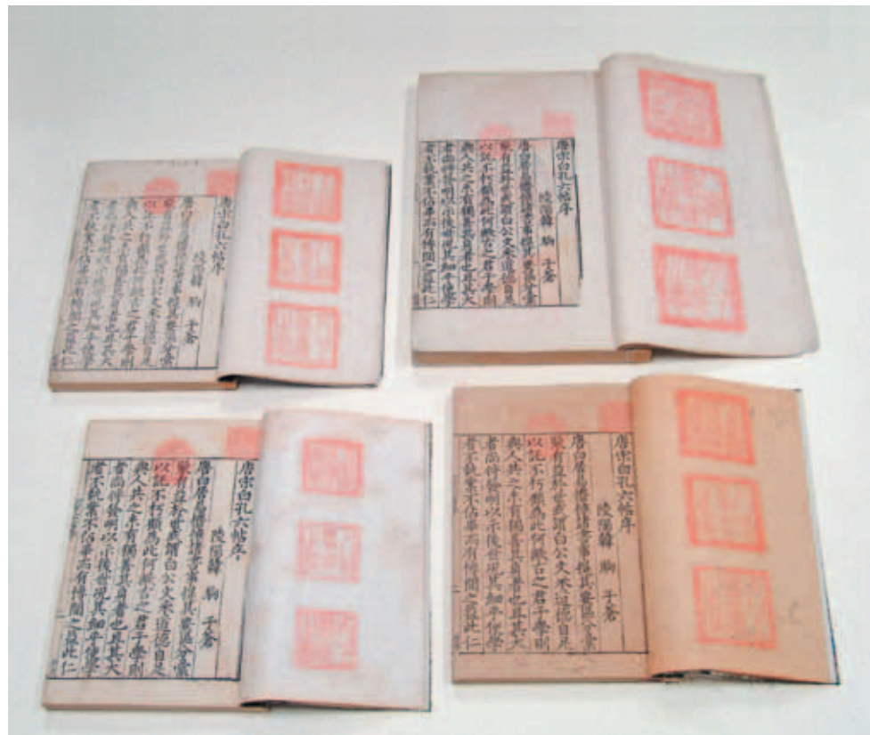
圖三 四部同一版摹印之「天祿琳琅」珍本《白孔六帖》 明嘉靖刻本 國立故宮博物院藏

《白帖》體例，採集唐五代以來詩、頌、銘，贊典籍資料彙編而成《六帖新書》三十卷，又名《後六帖》或