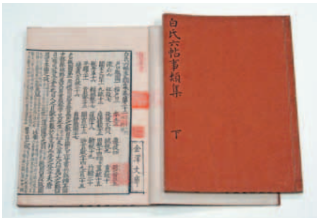
圖二 影宋鈔本 《白氏六帖事類集》日本江戶影寫天理圖書館藏宋紹興刊本 國立故宮博物院藏