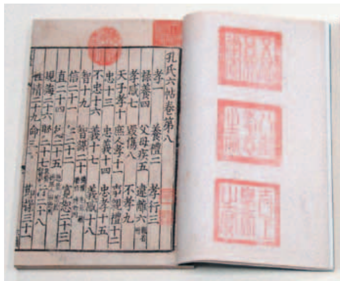
圖四 《孔氏六帖》 宋乾道二年（1166）韓仲道泉州刊本 國立故宮博物院藏

分別單行宋版《白帖》與《孔帖》同為明內府文淵閣藏書，據《日下舊聞考》記載文淵閣於明武宗正德四年（一五〇九）發生火災，歷代典籍稿簿因而俱焚，此二書卻能在災變中倖存，後同為宋筠所藏實屬難得。但相較於《白帖》流落海外，《孔帖》能幸運回宮，更獲珍藏收入「天祿琳琅」，以致今日能完善的典藏國立故宮博物院，並得以在展覽與觀