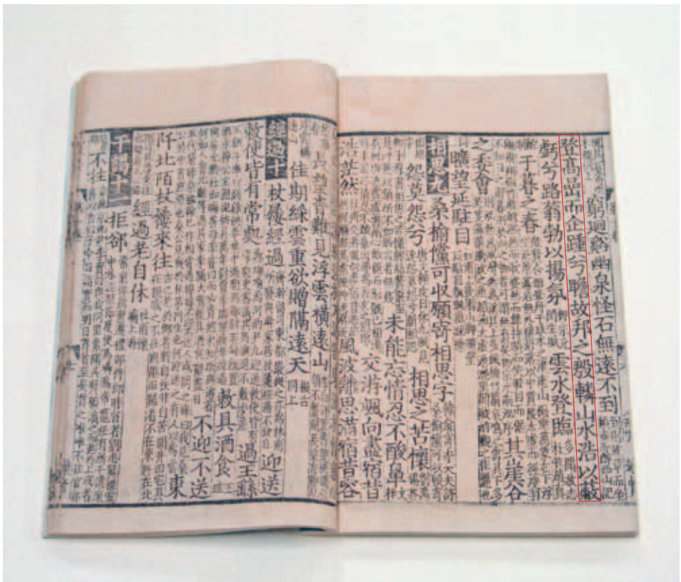
圖六 《孔氏六帖》 宋乾道二年（1166）韓仲道泉州刊本 卷十內頁 國立故宮博物院藏